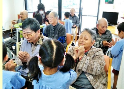
地元保育園との交流会