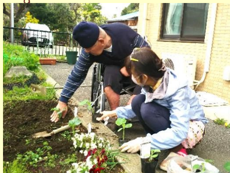
施設内の畑での家庭菜園

行事やイベントは何でもボランティアにお願いするのではなく、自分達で企画・運営しています