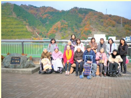
利用者様との遠足イベント

行事やイベントは何でもボランティアにお願いするのではなく、自分達で企画・運営しています