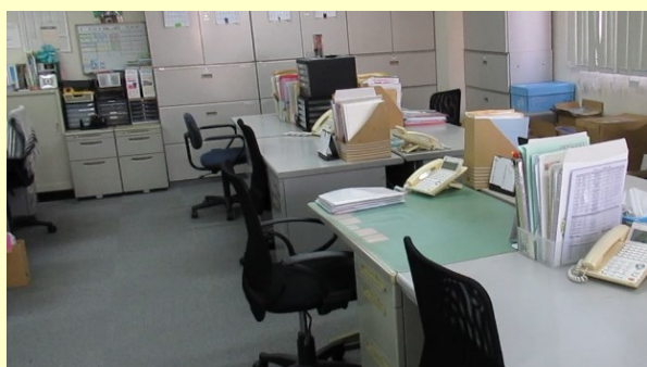
本社フロアの様子

職員や入居者の健康管理をしています。 看護師は、健診支援・受診支援・医療連携など をしています。管理栄養士は、施設利用者の 栄養管理や献立作成、厨房指導や衛生管理など をしています。