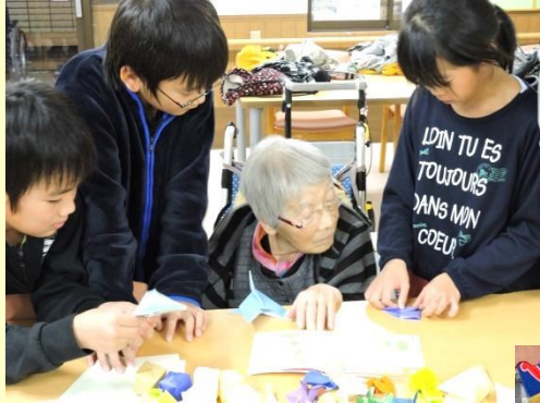
地元小学校との交流