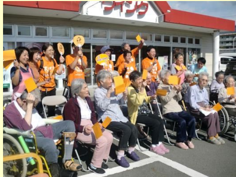
地域のイベントに参加