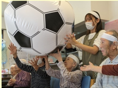
施設内での運動会