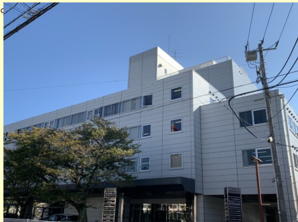
本社のある高島本町ビル

と言うのも、 安易に外部の業者や専門家に頼らず、自分達が、 一から調べて、全てを処理するからです。 そのため、職員は、 「仕事力」や「専門性」が着実に身に付きます。