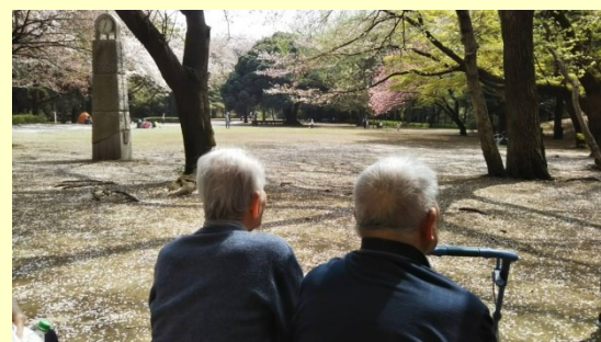
近所の公園にお散歩

だからこそ、私たち職員も様々な地域交流に参加し、施設で楽しいイベントを開催しています。