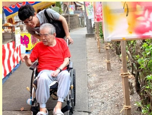
地域のお祭りへお出かけ